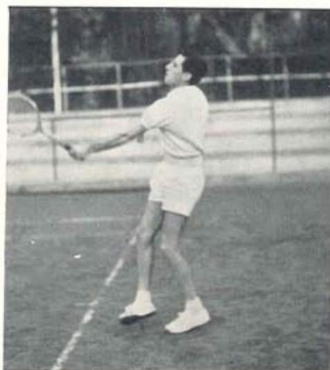
Scagnolari e Saitta i finalisti di Erice e del torneo Sociale