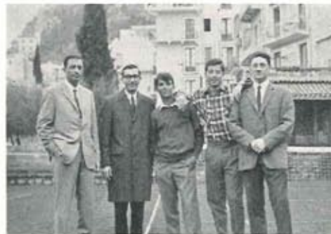
I Campioni Siciliani.

sate glorie. Quest'anno, non solo questa esortazione è stata raccolta, più che brillantemente, ma anzi sono state proprio