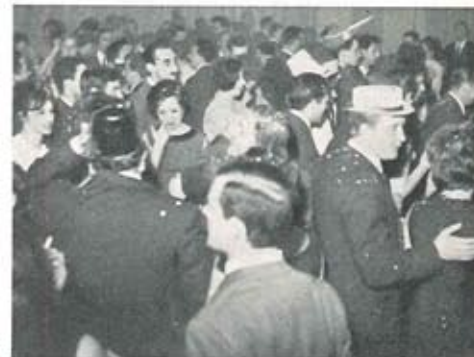
La veglia di Carnevale.

Abbiamo notato con piacere, oltre alla normale partecipazione dei giovani frequentatori del Circolo, altri Soci che raramente si erano visti in simili occasioni. Nella sala del nostro Circolo si registrava il « completo » solo dopo 30 minuti dallo inizio della serata. La distribuzione dei « cotillons » e delle piccole « armi » previste in queste occasioni, ha fatto sì che in un breve lasso di tempo l'ambiente si riscaldasse. L'ormai « unica » allegra comitiva