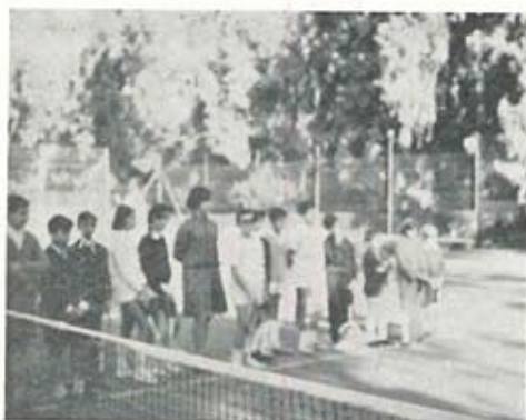
Le nuove Promesse.