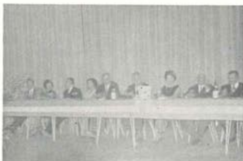
Il tavolo dei Dirigenti.

La sera del 10 febbraio si è rinnovata la simpatica iniziativa della cena sociale che ha visto raccolti insieme alla Deputazione i giocatori delle prime squadre che tanto bene hanno figurato quest'anno anche in campo nazionale (2° dopo Milano), i giudici arbitri più attivi, i rappresentanti della stampa (compositori, redattori...) Gradito ospite il Com. D'Antoni, delegato provinciale del Coni. Dopo un positivo giudizio su Carlos Primeirob,