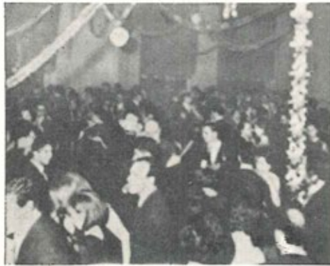
Il salone durante la festa.

le filanti, trombette sono stati gli ingredienti di questa battaglia combattuta all'ultimo fiato. Subire a fare gli scherzi era la maniera per sentirsi partecipi di questa allegria generale, lanciare coriandoli o stelle filanti era il modo di avvicinarsi conoscersi; e così abbiamo visto molti, dopo la lotta, prendersi per mano e ballare nel classico mattone, quei languidi motivi che sapientemente venivano alternati a quelli più rumorosi. Non dimenticheremo que-