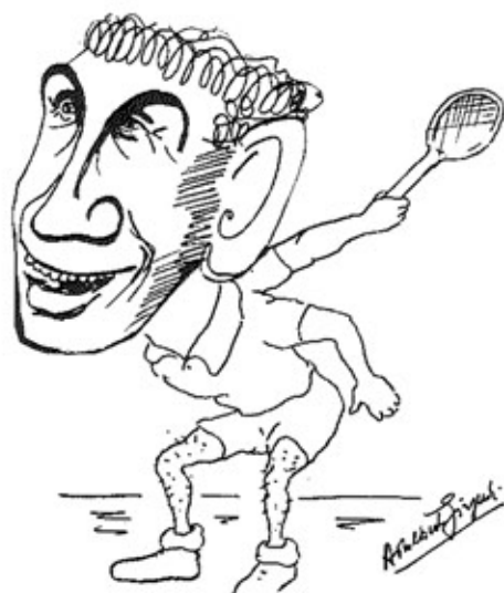
Il « MEMMO » Nazionale!

gno d'acciaio, e qui non c'entra la forza, ma la ben nota barriera di denti incapsulati. L'avversario è confuso dal suo stantuffare di locomotiva vecchio modello; è frastornato dal caratteristico battere i piedi, come i rinoceronti prima della carica. E la carica arriva quando la palla, superando la rete,