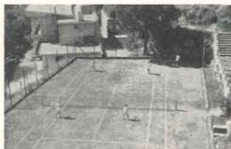
Il campo di S. Martino