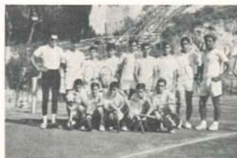
I ragazzi del 1° Corso

L'attività tecnica è stata basata sui vari esercizi sul servizio, sui colpi diagonali, sulla volée, ecc. e si è conclu-