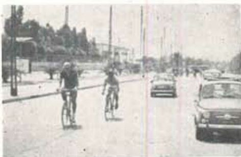
Durante la gara di Ciclismo

Dal 6 al 13 luglio ha avuto luogo una simpatica e ben riuscita manifestazione sportiva, che ha riunito ben 42 Soci dai 16 ai 23 anni.