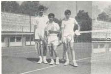
I ragazzi della Bonfiglio