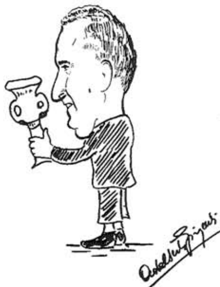
Il Leo... Nino

lare il mistero. Gli frughiamo poi nelle tasche; troviamo tutta una serie di tappi, scatolette, colli di bottiglia e finalmente ci spieghiamo come abbia fatto a trovare sempre per terra qualche cosa alla quale appioppare il solito calcetto. Il Guardiano del Circolo ci ha confermato la nostra supposizione: lo Ingegnere, ci ha raccontato Gambino, entra quatto, quatto nel buio della notte e si mette a seminare dappertutto degli oggettini strani... gli stessi che il