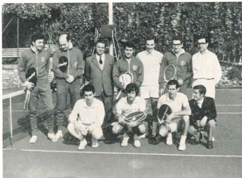
I tennisti palermitani e messinesi posano per la foto di rito