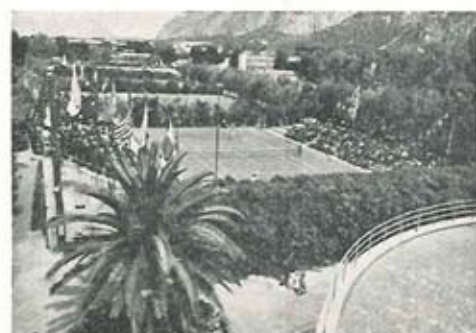
Una panoramica del campo centrale