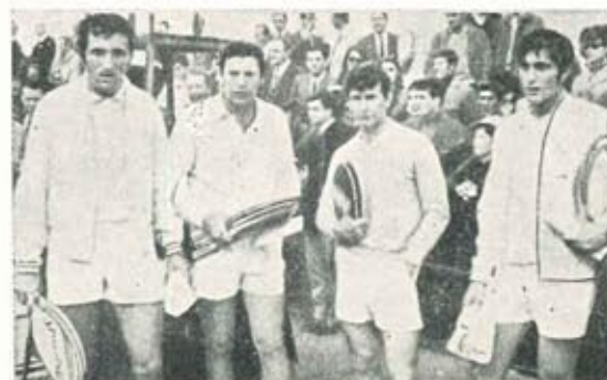
Tiriac, Pietrangeli, Mulligan e Nastase

Catania e che prelude quelli di Roma e Napoli, anche senza essere aperto ai professionisti, sarà, siamo certi, essere all'altezza della migliore tradizione.