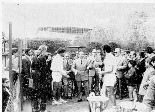
Premiazione dei vincitori del doppio uomini