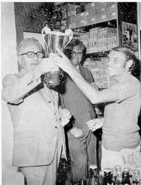
Il presidente con Baby Angioli