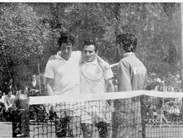
I finalisti Nastase e Gulyas

Questa 25ma edizione che doveva riservare al grosso pubblico palermitano la gioia di assistere ad un grandioso torneo, infatti le voci della vigilia, dapprima davano come possibile « open » il nostro torneo, poi svanita questa possibilità si parlava dell'arrivo del duo americano Ashe-Pasarell, ma anche questa operazione non è andata in porto, in quanto la F.I.T. non è riuscita a trovare un accordo con i due americani neanche per il torneo di Roma, cosicché le previste « nozze d'argento » sono divenute delle squallide nozze di rame, lo dimostra il fatto che il pubblico palermitano, già di per sé poco portato per il tennis, non è convenuto in massa come qualche anno addietro.