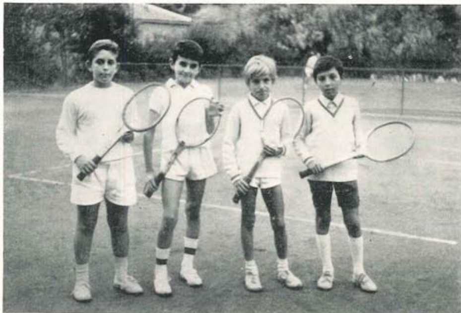
Nella foto: Quattro dei più promettenti allievi della Scuola Tennis.